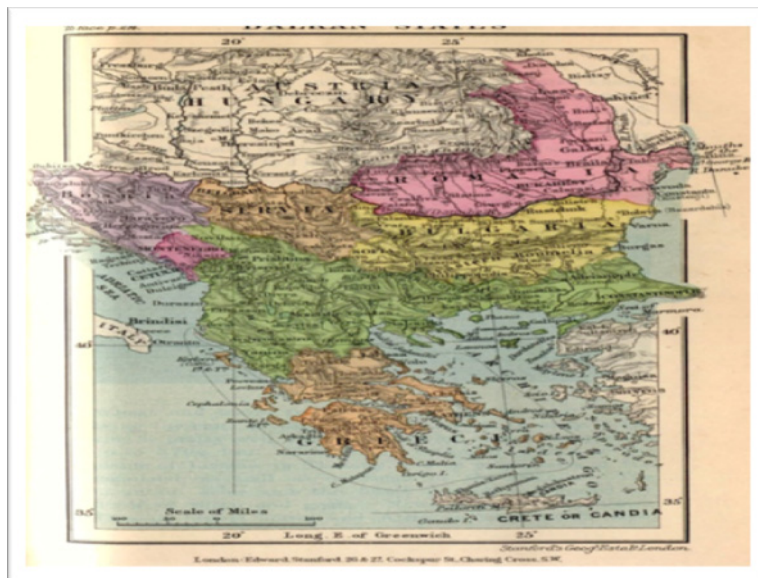
Приказ 8: Источни и Западни Балкан невидљивом линијом граница Србије са Румунијом и Бугарском: од Ђердапске клисуре преко Старе планине