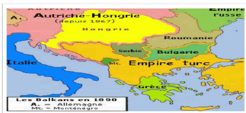
Приказ 7. Новоформиране балканске државе: архипелаг у отоманском мору „европске Турске”