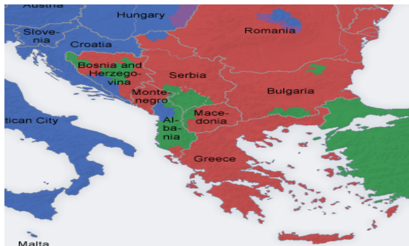
Приказ 1: Размештај цивилизација на Балканском полуострву

На крају, у оквиру овог простора попут леопардових шара налазе се и повеће енклаве исламске духовне и културне цивилизације. На крајњем истоку је монолитни, исламски, европски део Турске (око Мраморног мора са излазом на Босфор, и дуж турског дела Црног мора). Потом, ту су и два „исламска цепа” у Бугарској (један на југу у Тракији, и један, мањи, североисточни, у бугарском Подунављу). Албански исламски простор запоседа не само читаву централну већ и највећи део јужне (али и појас северне) Албаније у Проклетијама, потом готово читаву западну Македонију и готово читаву јужну српску покрајину Косово и Метохију, те погранични појас Грчке у Епиру. Коначно, ту су енклаве муслиманско-словенског живља, који се данас у највећем броју изјашњава као Бошњаци (у Рашкој или Санџаку у Србији, на северу Црне Горе, и највише у централној Босни све до средњих токова Неретве до Стоца, као и у Цазинској Крајини).