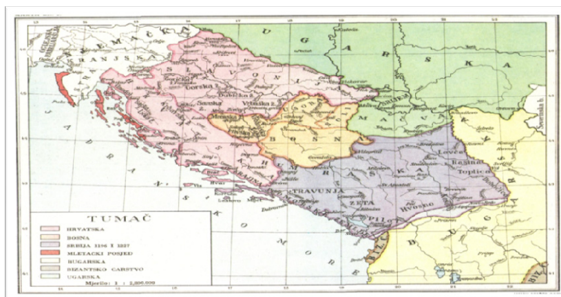
Приказ 3: Србија – од Неретве до Дрима, развијени средњи век Figure 3: Serbia - from the Neretva to the Drim, High Middle

Упадом номадских племена кроз Врата народа, из правца средњоазијских степа простором Балкана овладавају словенска племена са севера и североистока континента. Формирају се прве јужнословенске државе на простору Балкана: држава Хрвата, Срба и Бугара.