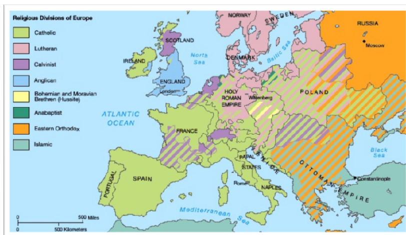
Приказ 6: Остаци православног простора на Балкану под исламско-отоманском управом. Иза лимеса Antemurale christianitatis – улаз у нови век, XVI столеће

ма Балкана постали мањина; они су били тек острва у исламско-сунитском мору отоманских провинција. 3